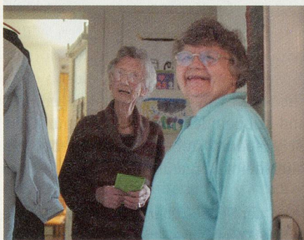
Eine Hausnachbarin schaut für einen Schwatz noch kurz vorbei.