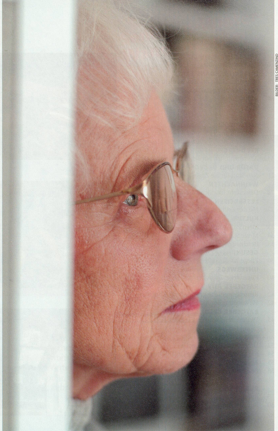
BILDER: TRES CAMEZIND