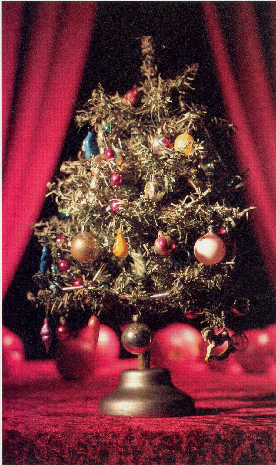
BILDER TRÉS CAMEZIND / STYLING ADELHEID GISLER

Wie auch immer sie feiern, für viele ist Weihnachten etwas ganz Besonderes. Zeitlupe-Mitarbeiterin Katja Müller sprach mit Leserinnen und Lesern, welcher Gegenstand für sie Weihnachten bedeutet.