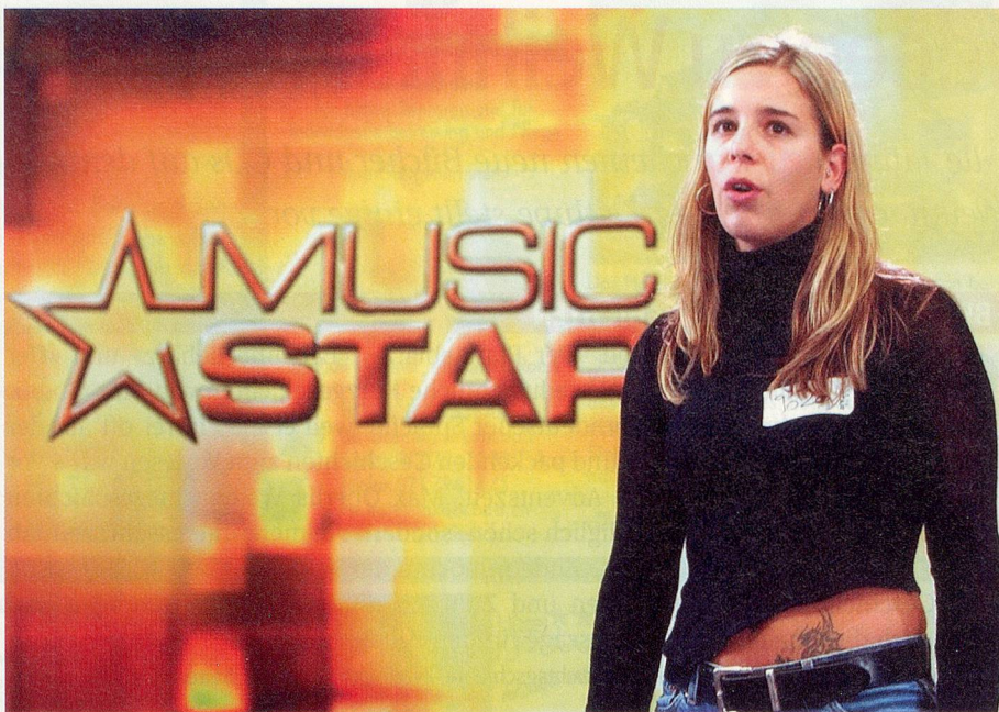
Hoffen auf die grosse Karriere: Ab Dezember singen künftige Stars auf SF DRS.