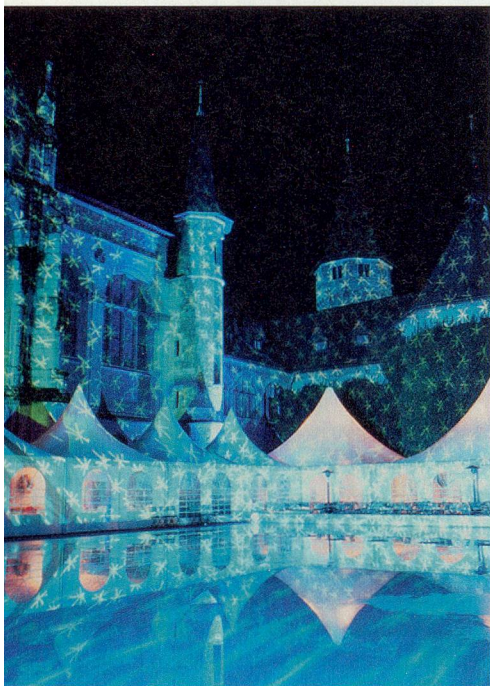
Zauberhafte Märchenwelt mit Eisbahn, direkt beim Zürcher Hauptbahnhof.

«Live on Ice», Schweizerisches Landesmuseum Zürich, Museumsstrasse 2, direkt beim Hauptbahnhof. Täglich von 10 bis 22 Uhr; Eintritt frei; Schlittschuhe können gemietet werden. Noch bis zum 4. Januar 2004. Mehr Infos unter www.liveonice.ch