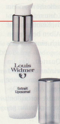
Frisches Hautgefühl: Extrait Liposomal von Louis Widmer: Anti-Aging-Pflege für Gesicht, Hals und Dekolleté. 30 ml ca. CHF 53.–