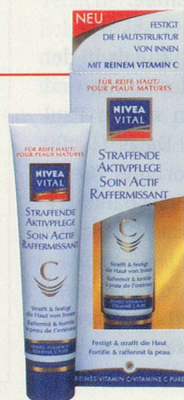
Nährt und festigt: Tagespflege aus der Linie Nivea Vital für die reife Haut. 40 ml ca. CHF 24.90