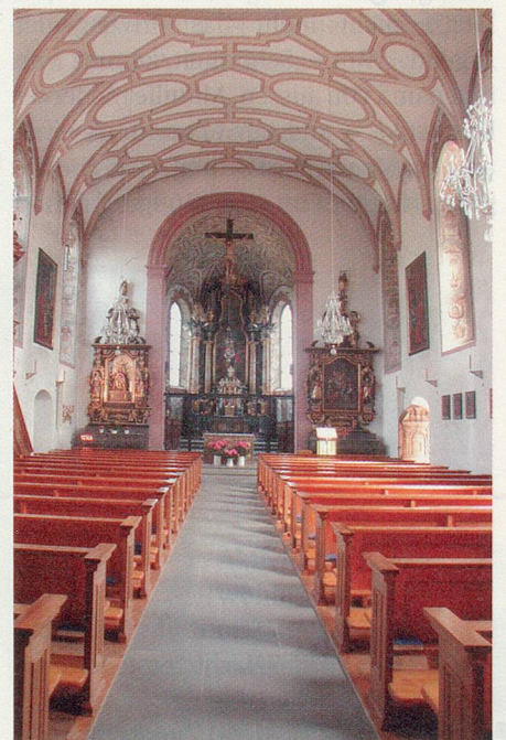
Die Klosterkirche – mit ihren verschiedenen architektonischen Stilrichtungen.

Neu entdeckt wurde das Pilgern in den Sechzigerjahren des zwanzigsten Jahrhunderts. Nicht nur Menschen mit einer religiösen Überzeugung sind dabei unterwegs. Viele Wanderer sind auf der Suche nach sich selbst, nehmen eine Auszeit vom hektischen Alltag, sind Abenteurer oder schätzen ganz einfach die Be-