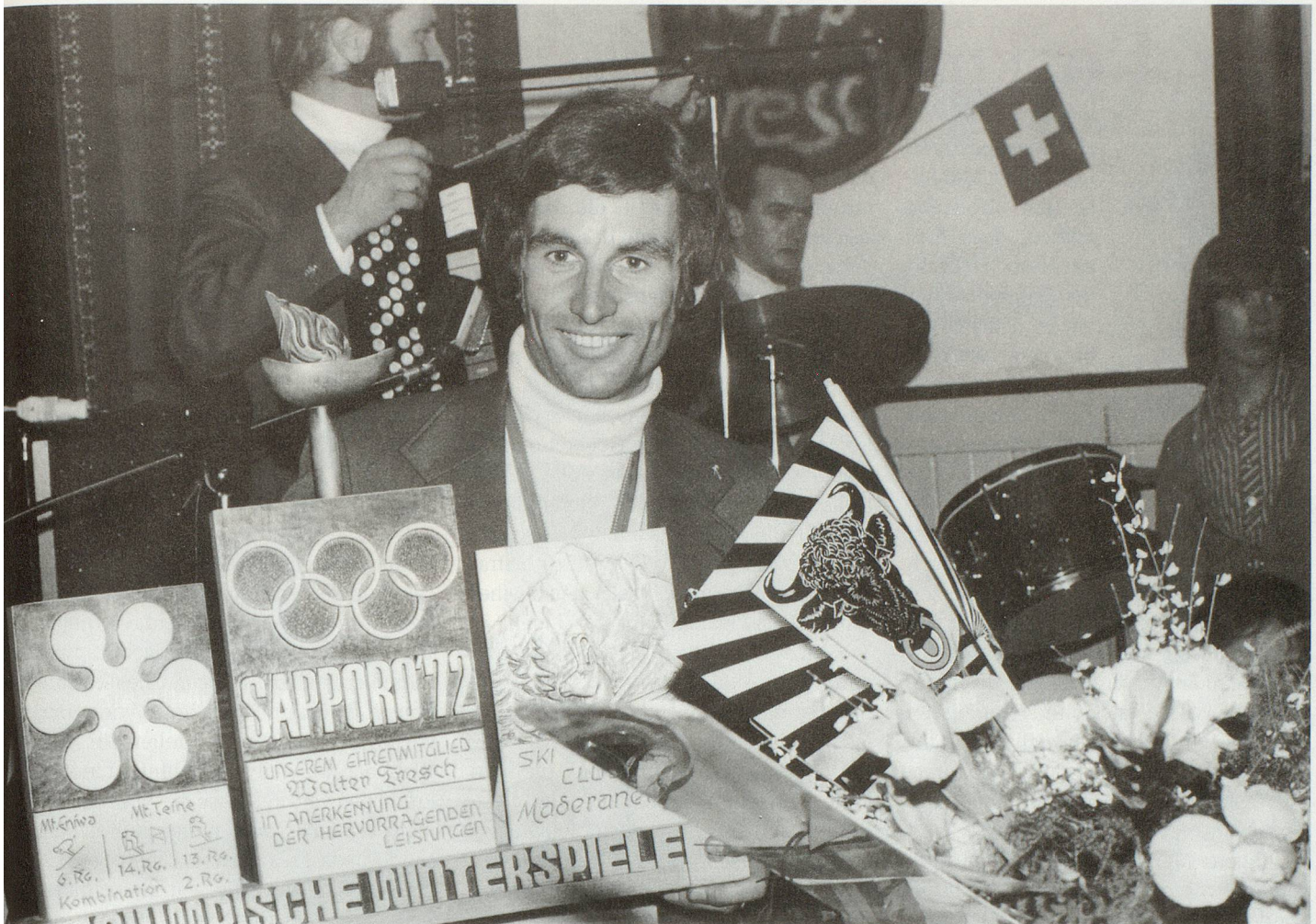
Grosse Feier im Urnerland für den Medaillengewinner Walter Tresch nach seiner Heimkehr aus Sapporo 1972.

Als er anfang, Regionalrennen zu fahren, gewann er fast alles, was zu gewinnen war. Der nationale Skiverband wurde auf ihn aufmerksam, lud ihn zu einem Kurs in Andermatt ein. Und schon Mitte der ersten Woche durfte er in St. Moritz an einer Ausscheidung teilnehmen, bei der die ganze Nationalmannschaft zugegen war. 1966 war das. «Ich ging da als Unbekannter hoch – und fuhr mit meinen Resultaten mitten hinein in die Nationalmannschaft», strahlt er. Dort lernte er auch Russi kennen, und von da an trainierten die beiden Urner zusammen.