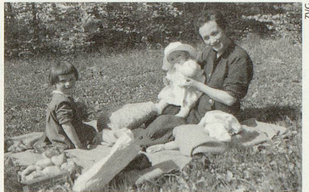
9. Mai 1954, Muttertag: Die junge Familie fuhr zum Picknick nach Aarberg.

Erinnerungen an eine lebensfrohe, grosszügige Frau, an eine Mutter, die ein offenes Haus, ein offenes Ohr und ein offenes Herz hatte. Nicht nur für die Familie, für Freunde und für Nachbarn, sondern auch für deren Freunde und Bekannte: für alle, die ein Essen oder auch nur einen Tee, ein Gespräch oder einen Rat nötig hatten.