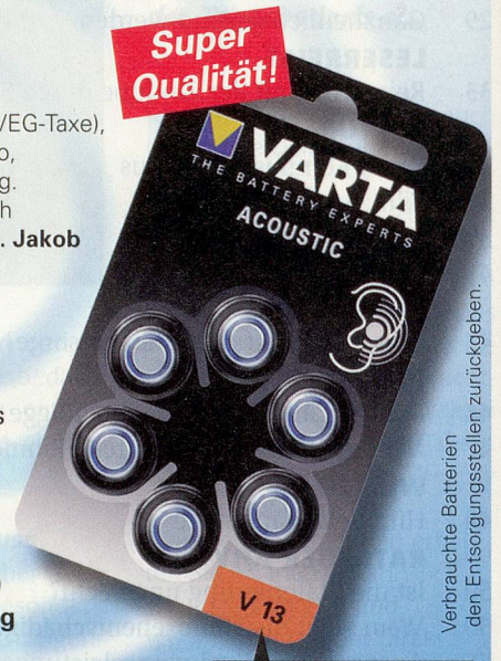
Verbrauchte Batterien den Entsorgungsstellen zurückgeben.

1 Hörgerätebatterietester im Wert von Fr. 10.50 zu jeder Bestellung ab 54 Batterien