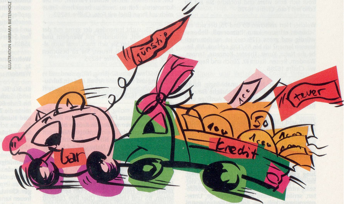
ILLUSTRATION BARBARA BIETENHOLZ

mit Zinssätzen zwischen 9 und 12,5 Prozent teuer. Positiv für den Privaten ist dafür, dass die Zinsen vom Einkommen abziehbar sind und daher die Steuerrechnung reduzieren.