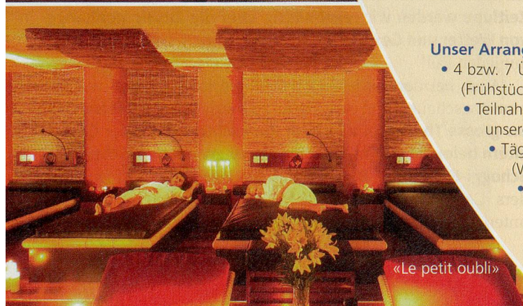
«Le petit oubli»