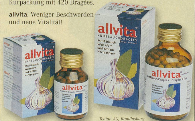
Tentax AG, Ramllinsburg

allvita: Weniger Beschwerden und neue Vitalität!