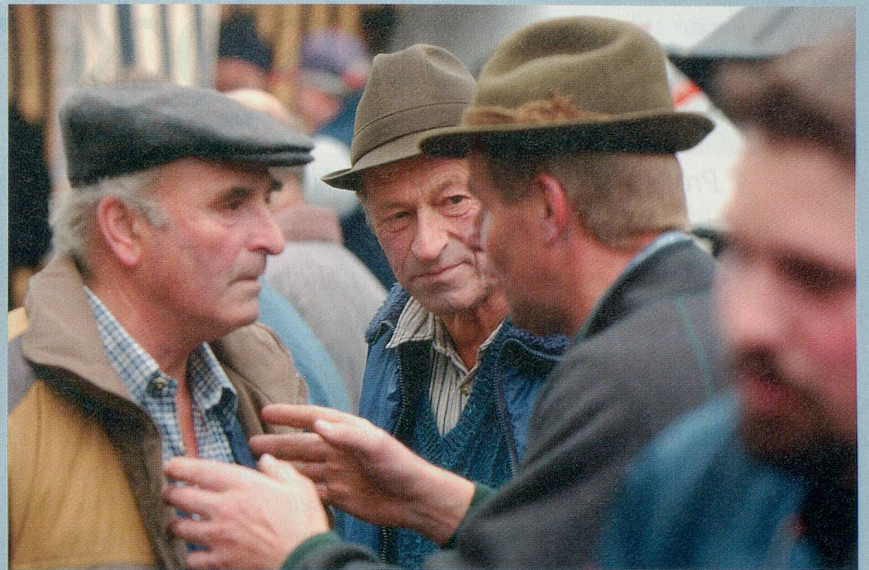
Kunterbuntes Treiben: Am «Kalten Markt» gibts für (fast) jeden Geschmack das Richtige. Das Angebot reicht von landwirtschaftlichen Maschinen und Motorsägen über Würste bis zu frisch gebackenem Brot und Süßigkeiten. Der richtige Ort zum Feilschen, Diskutieren und Geldausgeben.