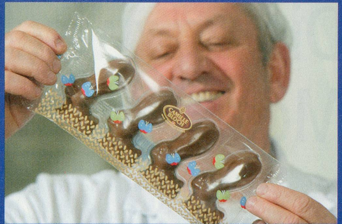
Die Etikette: Mit dem Firmenlogo versehen und von bunten Schmetterlingen umflattert, segeln die Hasen Ostern entgegen.

Raum hängend, die sich mit lautem Getöse langsam um ihre eigene Achse dreht. Damit nicht genug: Auch die auf der Stahlrolle befestigten Hakenarme drehen sich vibrierend im Kreis. Die unzähligen Metallrahmen wirken an der Rolle wie die abstehenden Stacheln eines umgestürzten Riesenkaktus. Sie führen einen eigenartigen Tanz auf, drehen sich nach allen Richtungen, werden gewendet, gerüttelt und geschüttelt, damit sich die flüssige Schokolade an der Innenwand der Formen verteilt, bis in die letzte Ritze dringt.