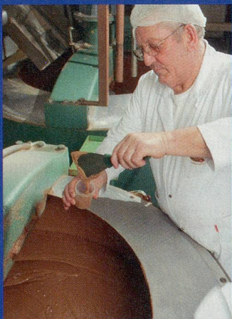
Der Rohstoff: Die «Conchen» machen Pulver zu Schoggi.

Die Hasen sitzen in den bunten Nestern. Aber mal ehrlich: Wer von uns weiss, wie so ein Schoggihase entsteht? Wir waren bei der Geburt von Osterhase Oskar dabei.