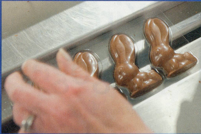
Die Verpackung: In der «Flowpack»-Verpackungsmaschine erhalten die Häschen in Reih und Glied ihre Zellophanhülle.