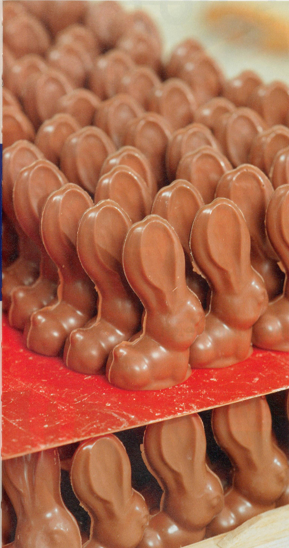
BILDER: HEINER H. SCHMITT