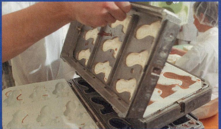
Die zweite Hälfte: In Metallrahmen werden die beiden Hasenhälften zusammengesetzt. Und ab gehts in die Schleudermaschine.