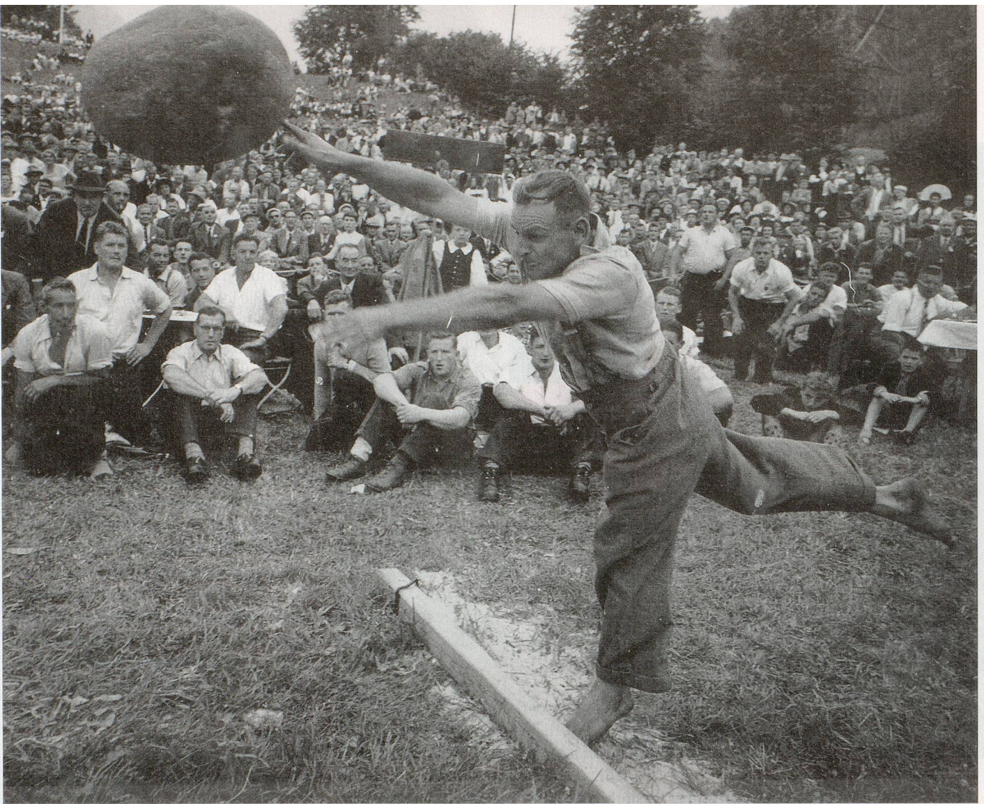
Ein Fest für starke Männer: Ein kräftiger Steinstösser am 150-Jahr-Jubiläumsfest von 1955.