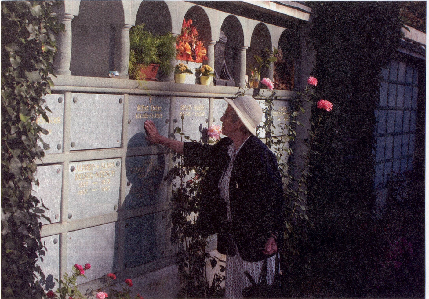
Stilles Zwiegespräch: Grabstätten schaffen eine Verbindung zu den Verstorbenen, sind aber auch Orte für neue Bekanntschaften.

men meistens am Abend hierher», sagen die Frauen, die man hier auf dem Friedhof trifft. Natürlich gibt es auch Gespräche – man sagt einander guten Tag, wechselt ein paar Worte, spricht über das Unkraut auf den Gräbern, das einem zu schaffen macht. Man müsse ein bisschen vorsichtig sein, finden die Frauen. Es heisse sonst schnell einmal, diese Frau spreche immer mit den Männern.