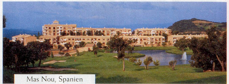
Mas Nou, Spanien

Dieses Vertrauen wissen wir zu schätzen. Bei Hapimag erleben Sie keine unliebsamen Überraschungen. Unter anderem, weil Bau und Betrieb der Resorts in unserer Hand liegen. Und weil wir bei entscheidenden Kriterien wie Standortwahl, Komfort, Sauberkeit, Infrastruktur und Services kommisslos nur das Beste bieten.