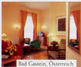
Bad Gastein, Österreich