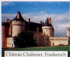
Château Chabenet, Frankreich