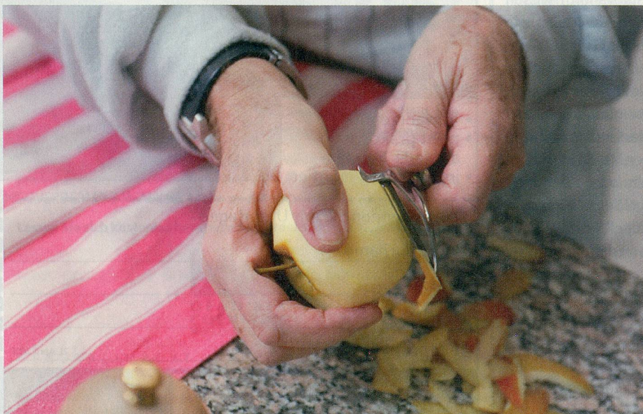
Fremdes Handwerk: Auch beim Äpfelschälen werden die neuen Fertigkeiten erprobt.