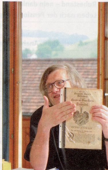
BILDER: SONJA RUCKSTUHL