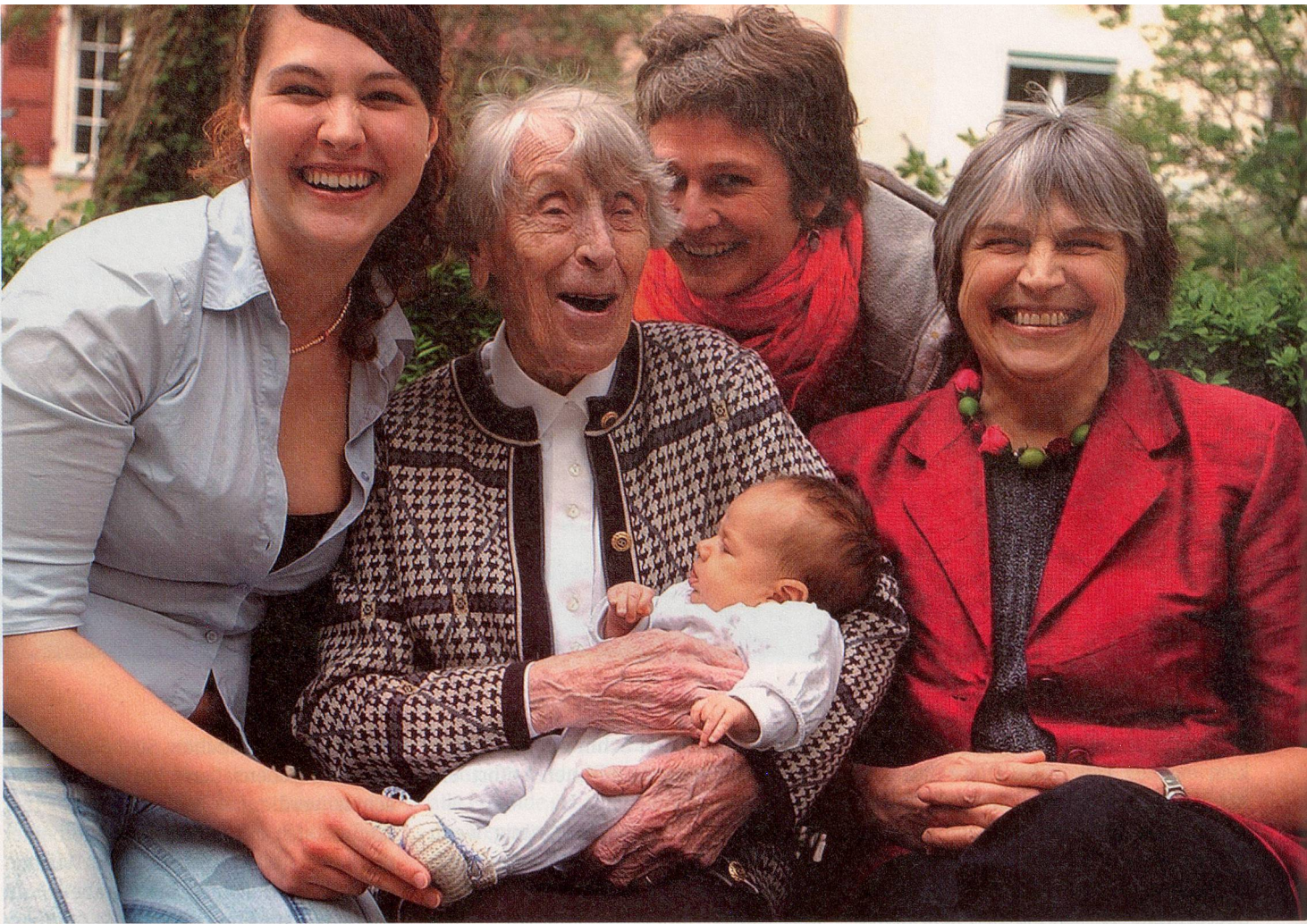
Fünf Generationen im Bild: Die Solidarität unter den verschiedenen Altersgruppen ist noch immer ein modernes Konzept.