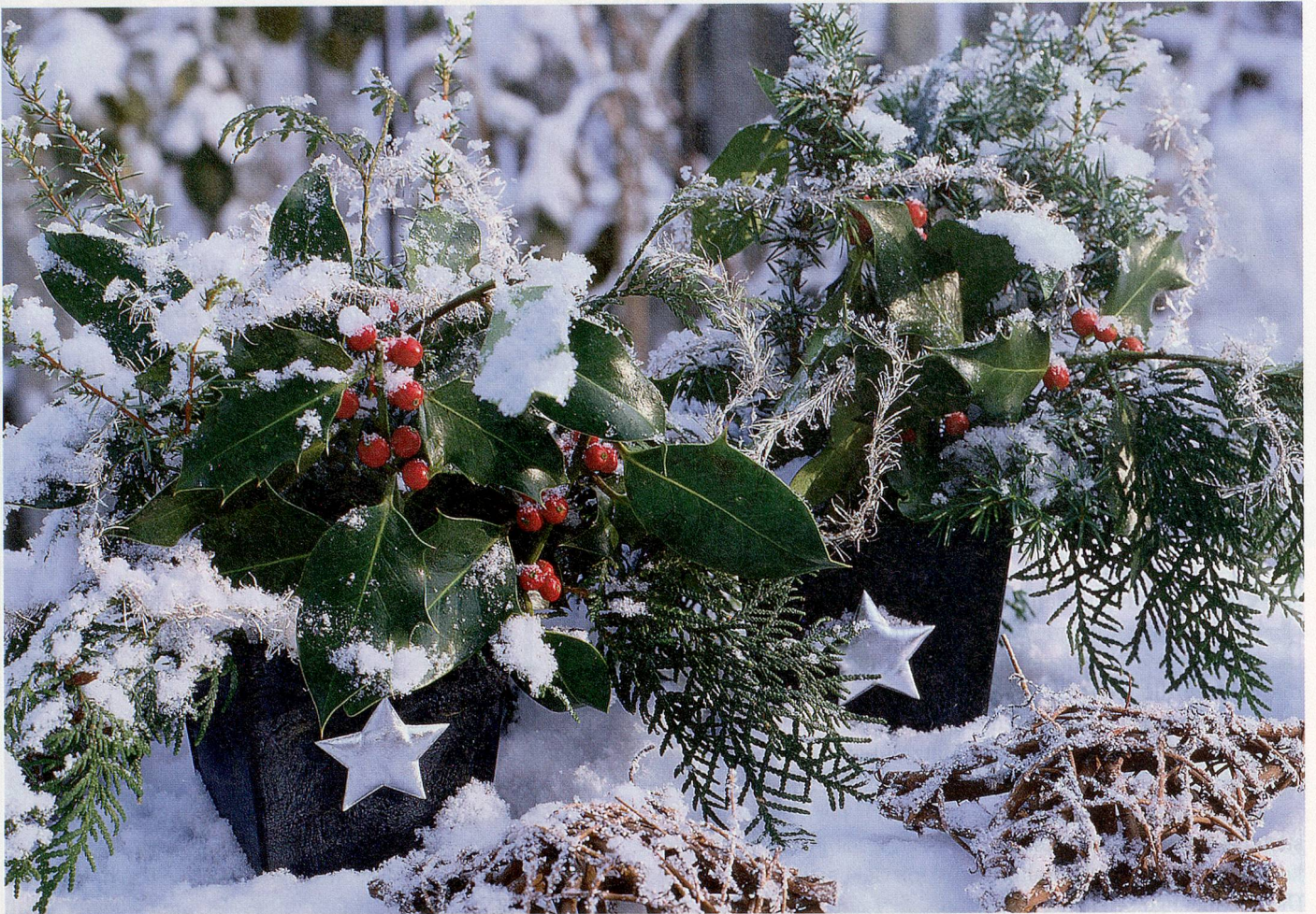
Die Alternative für die Festtage: Die Stechpalme sticht für viele sogar die traditionellen Tannenzweige aus.