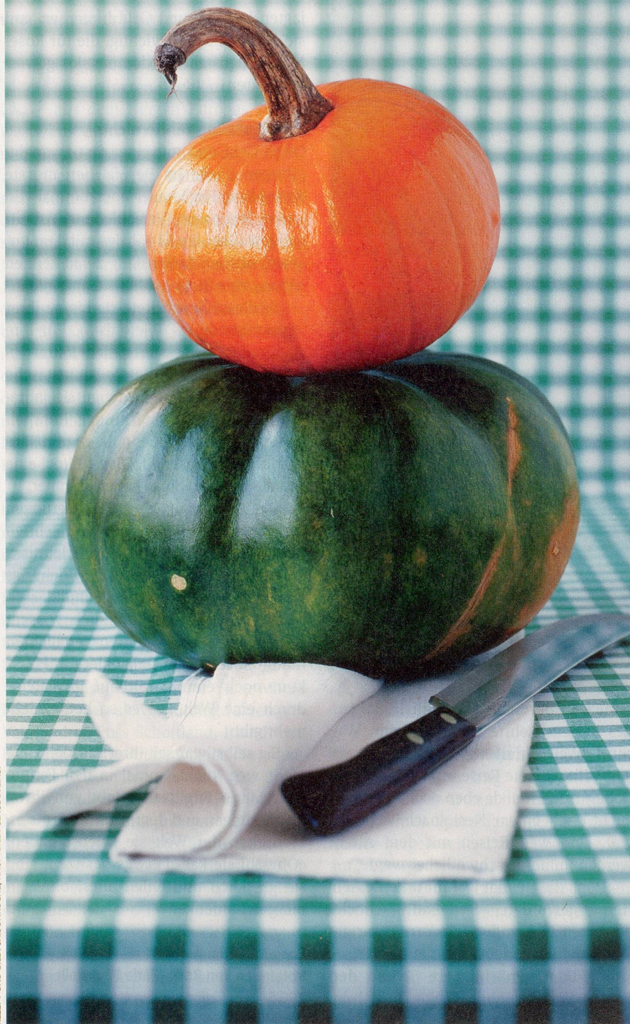
REZEPT UND BILD: SAISONKÜCHE; HAUPTBILD: CLAUDIA LINZI

Da thront der Kürbis auf dem Kompost, orange und riesig. Die Frage, wer den grössten hat, scheint oft wichtiger als die Qualität.