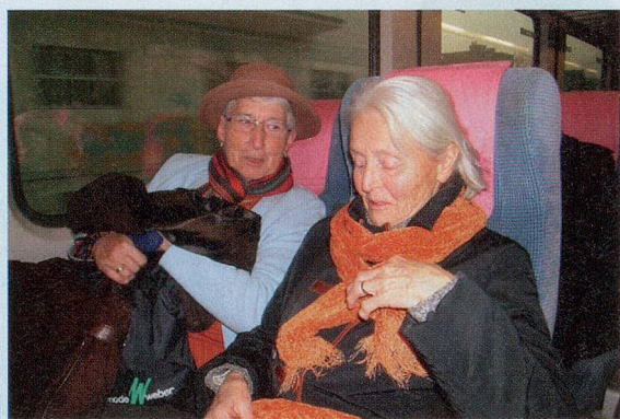
BILDER: BARBARA TRÜNGER