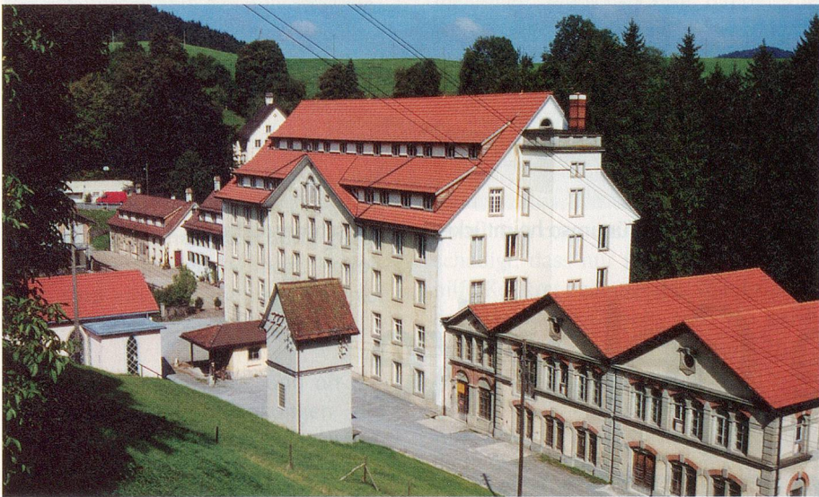
Traditionsreich: Die Spinnerei in Neuthal hat die ganze Industriegeschichte miterlebt.