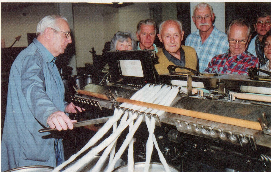
Lehrreich: Die alten Fabrikationsanlagen ziehen ein interessiertes Publikum in Bann.

gagements ehemaliger Rieter-Monteur und von Textilunternehmern aus verschiedenen Ländern zurück in die Schweiz geholt wurden. Freiwillige Experten, die in der Textilindustrie tätig waren und selber mit diesen Anlagen gearbeitet haben, sorgen für deren Unterhalt und leiten die Führungen.