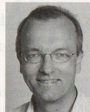
DAGEGEN: Hans-Jürg Fehr, Präsident der SP Schweiz, Nationalrat SH

Die Besteuerung von Personen und Betrieben soll gerecht erfolgen. Gerecht heisst: Wer mehr verdient und mehr besitzt, zahlt mehr, wer weniger verdient und weniger besitzt, zahlt weniger. Die Bundesverfassung nennt dies: Besteuerung nach der wirtschaftlichen Leistungsfähigkeit. Konkret umgesetzt wurde dieser Grundsatz bis vor Kurzem überall mithilfe der Steuerprogression: Je höher das Einkommen, desto höher der Steuersatz.