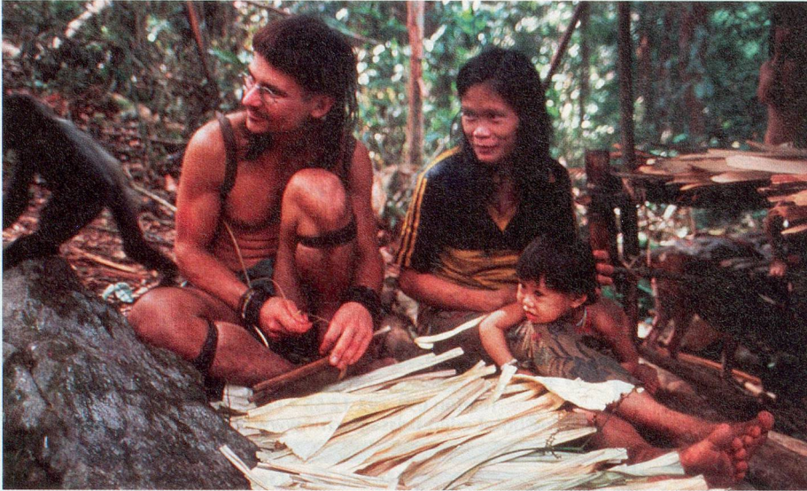
Zum Nomaden geworden: Bruno Manser bei seinen Penan-Freunden in Sarawak.