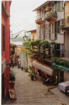
Gang nach Süden: Como offeriert das Erlebnis Italien mitten in den Alpen.

Ebenfalls am See, direkt neben dem Denkmal für die Gefallenen des Ersten Weltkriegs, befindet sich der Tempio Voltiano. Darin sind die erste Batterie, Instrumente, Laboreinrichtungen, Experimentierwerkzeuge und persönliche Gegenstände des berühmtesten Comers zu sehen: Der Physiker Alessandro Volta, 1745–1827, lebte und dozierte am Lario. Der Volta-Rundgang durch die Stadt folgt den Spuren des Elektrizitätsforschers –