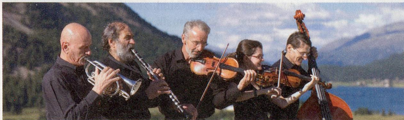
Bündnermusik ohne Schwyzerörgeli: Ils Fränzlis da Tschlin aus dem Engadin.