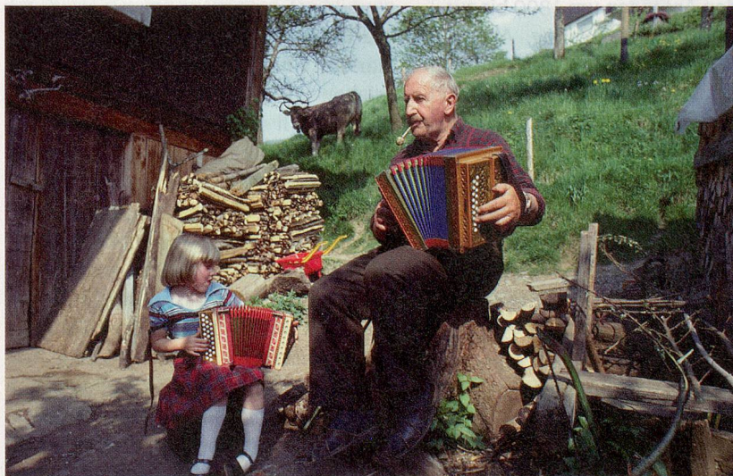
Urgestein mit Ausstrahlung: Der legendäre Schwyzerörgeler Rees Gwerder.