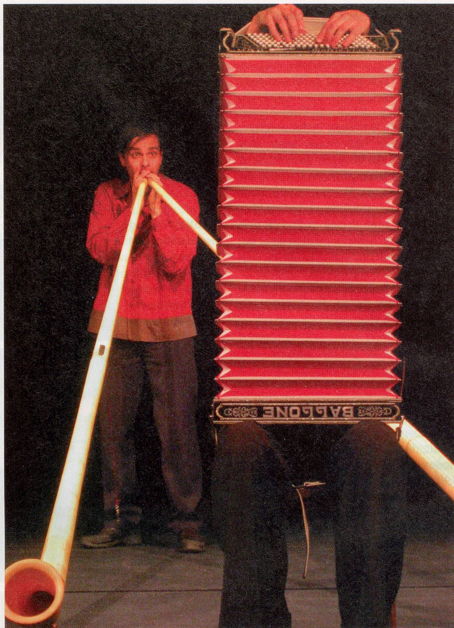
Archaisch: Das Duo Stimmhorn lässt die Welt ganz andere Schweizer Töne hören.

In Altdorf steht auch das Haus der Volksmusik, das sich mit Konzerten, Kursen und Workshops für die neue alte Volksmusik einsetzt. In Uri, Schwyz und Unterwalden hört man besonders viele andere Töne. Der moderne Rütlichswur wird von den Musen geschworen. ■