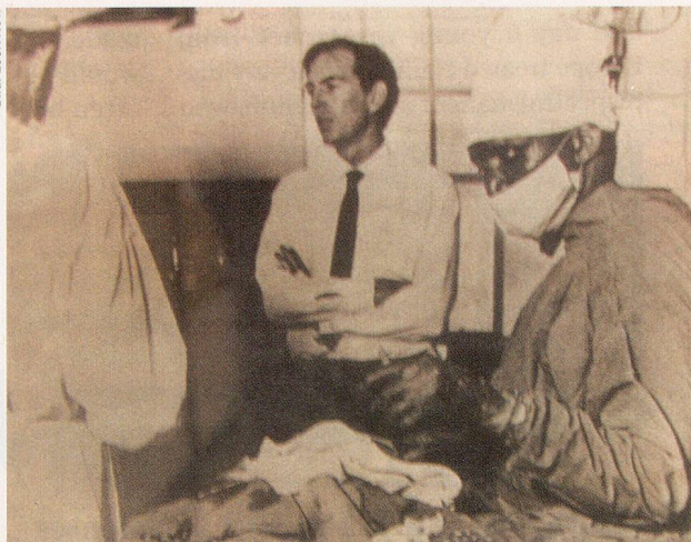
Star mit Schatten- seiten: Christian Barnard, dem die erste Herztrans- plantation gelang.