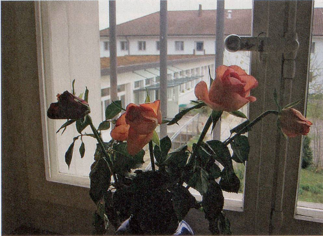
Ein Blick durch Gitter: Aus einem Zimmer im Frauengefängnis Hindelbank.