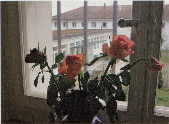
Ein Blick durch Gitter: Aus einem Zimmer im Frauengefängnis Hindelbank.