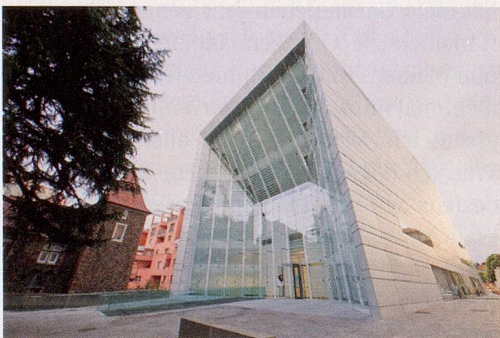
Bozens Museion, der neueste Tempel für moderne und zeitgenössische Kunst.

Man nehme die SBB bis Landquart, steige in die Rhätische Bahn um und fahre bis Zernez. Hier wechselt man ins Postauto. Dieses kurvt durch ein schönes Stück Nationalpark und hält nach einem Nickerchen – der Chauffeur bleibt natürlich hellwach – im Alpenstädtchen Mals. Schon Italien? Ma sì, auch wenn der mo-