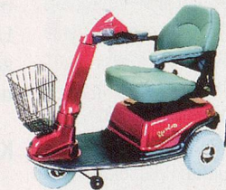
600T – komfortabel, wendig, kompakt.

Liteway 3 / 4 – wendig und stabil, mit 3 oder 4 Rädern, leicht faltbar und transportierbar.