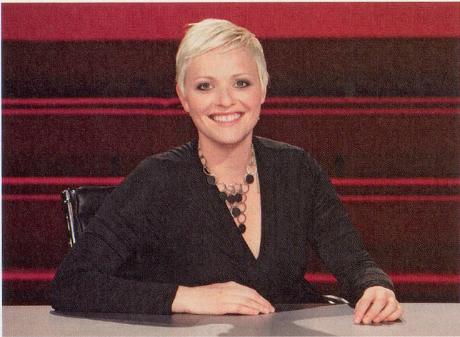
Die Quizmasterin ist zurück: Susanne Kunz moderiert ab Herbst «1 gegen 100».