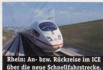
Rhein: An- bzw. Rückreise im ICE über die neue Schnellfahrstrecke.

Schiffe der guten Mittelklasse mit Auskabinen (Standard ca. 12 m 2 ) für 184 bzw. 174 (MS My Story) Passagiere. Alle Kabinen mit Dusche/WC, Haartrockner, zentral gesteuerte Lüftung und SAT-TV. Die Fenster lassen sich nur auf dem Oberdeck öffnen. Gutbürgerliche Küche wird im Panorama-Restaurant «zur frohen Aussicht» zu einer Tischzeit serviert. Zur Bordausstattung gehören Panoramasalon mit Bar, teilweise überdachtes Sonnendeck mit beheiztem Swimmingpool (MS Alemannia/Britannia), Saunabereich (MS My Story). Nichtraucherschiffe.