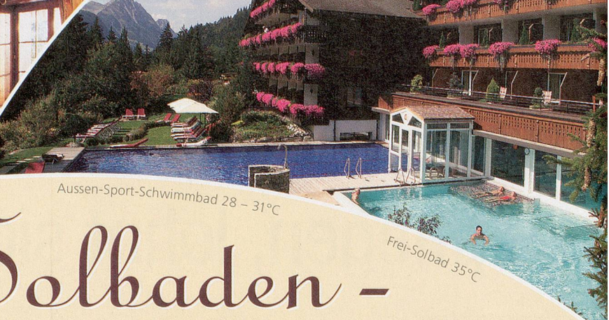
Aussen-Sport-Schwimmbad 28 – 31°C