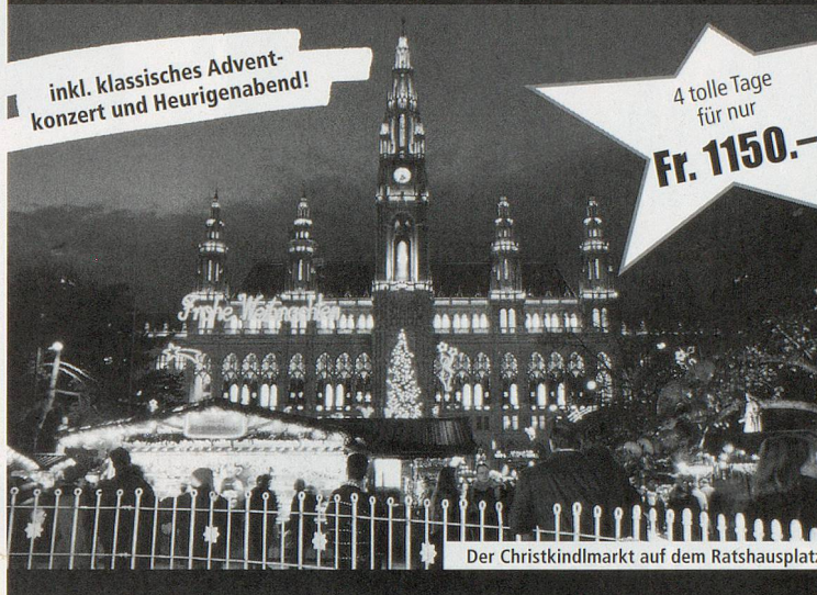
Der Christkindlmarkt auf dem Rathausplatz