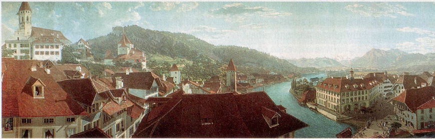
Das Thun-Panorama von heute und von gestern: Auf der Website www.thun-panorama.com lassen sich die Rundumsichten mit 200 Jahren Unterschied genau vergleichen.