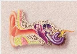
Unser Ohr ist ein komplexes Organ – und unverzichtbar. Wir sagen Ihnen mehr dazu.

Die Teilnahme ist kostenlos und unverbindlich. Amplifon offeriert allen Gästen im Anschluss an den Vortrag einen Apéro und ein kleines Überraschungsgeschenk. Sollten Sie an keinem der Termine Zeit haben, können Sie jederzeit auch eines der Amplifon-Fachgeschäfte besuchen: www.amplifon.ch