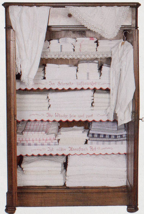
«Urgrossmutter's Wäscheschrank: sticken, häkeln, nähen...»,

Einst der Stolz der Bräute: In Biel sind Wäscheschränke und ihr kostbarer Inhalt aus früheren Zeiten zu sehen.