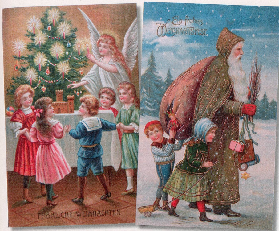
Bilder: Aus «O du fröhliche – Prosit Neujahr!»