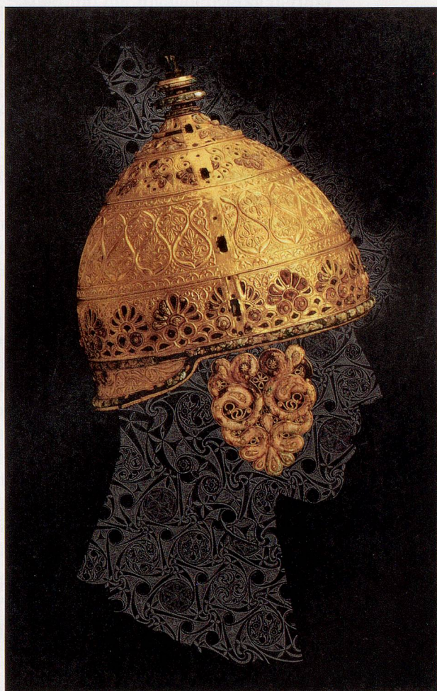
Auch dieser mit Goldblech überzogene Helm aus Agris in Frankreich zeigt die grosse Ornamentkunst der keltischen Handwerker.

Das schlechte Image als wilde Raufbolde verdankten die Kelten ihrer Schriftlosigkeit, die den Chronisten ihrer Gegner keine Eigenpropaganda