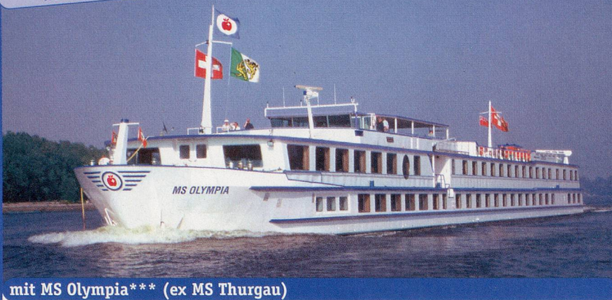
mit MS Olympia*** (ex MS Thurgau)