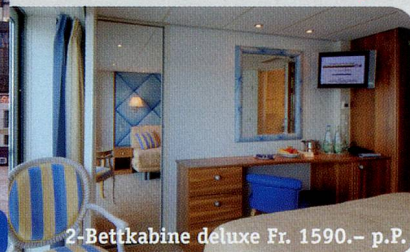
2-Bettkabine deluxe Fr. 1590.- p.P.

Rabatt Fr. 1000.- weil ein australisches Reisebüro das Schiff wegen der Finanzkrise annulliert hat. 8 Tage ab netto nur Fr. 990.- p.P