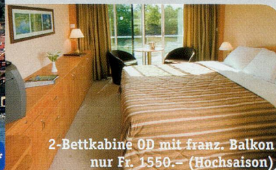
2-Bettkabine OD mit franz. Balkon nur Fr. 1550.- (Hochsaison)

Rabatt Fr. 1000.- weil das Schiff vom amerika- nischen Markt abgezogen wurde 8 Tage ab netto nur Fr. 900.- p.P