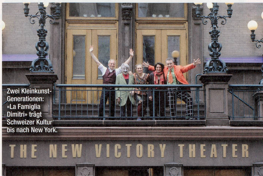
Zwei Kleinkunst- Generationen: «La Famiglia Dimitri» trägt Schweizer Kultur bis nach New York.