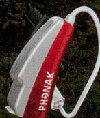
Abbildung: Audeo S MINI Hörgerät in Originalgrösse.

www.phonak.ch/hoeren Hörverlust ist kein Grund zur Sorge, aber ein Grund zum Handeln.