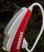
Abbildung: Audeo S MINI Hörgerät in Originalgrösse.

www.phonak.ch/hoeren Hörverlust ist kein Grund zur Sorge, aber ein Grund zum Handeln.