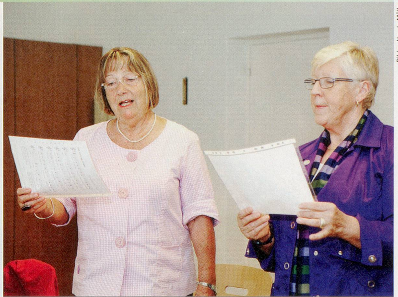
Bilder: Ursula Müller

«Shanty», also ein Seemannslied, das die Matrosen früher zu ihrer harten Arbeit auf dem Schiffsdeck sangen. Vierstimmig als Kanon erklingt das australische Kinderlied «Kookaburra», ein Stück über den Vogel Lachender Hans, dessen Ruf wie Gelächter klingt.