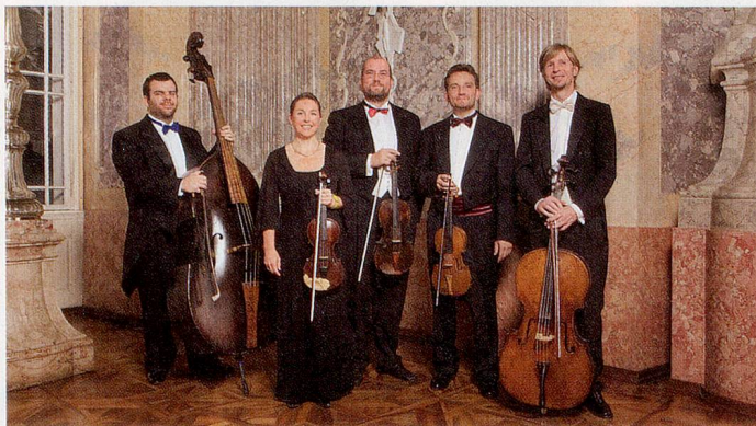
Das Concilium musicum Wien begeisterte mit seinem Konzert im bis auf den letzten Platz gefüllten Fraumünster.