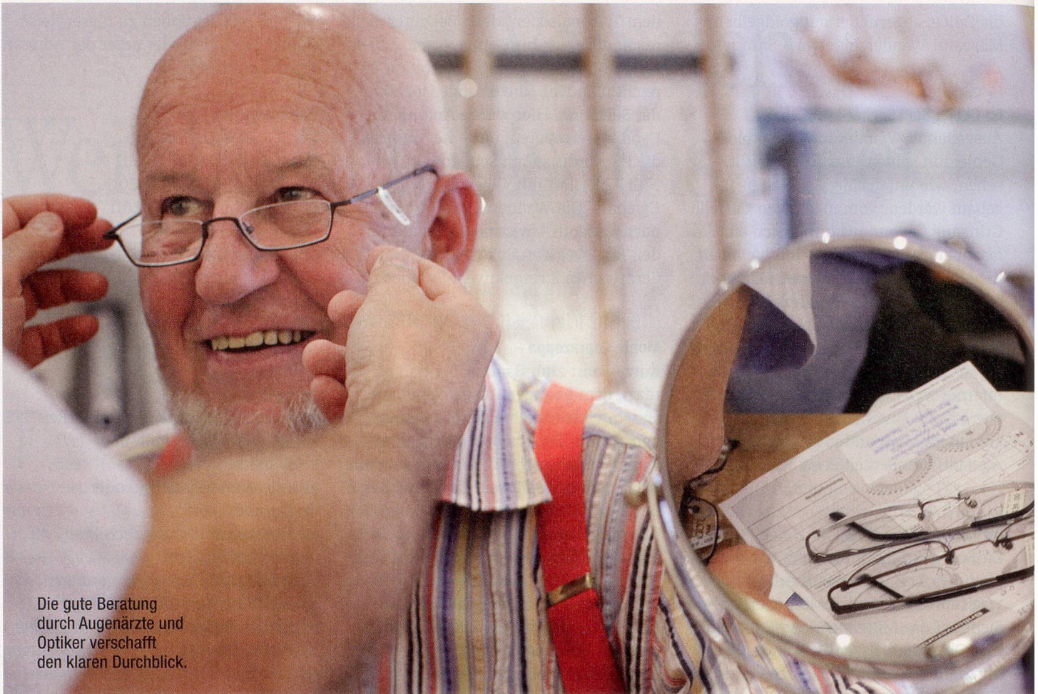
Die gute Beratung durch Augenärzte und Optiker verschafft den klaren Durchblick.