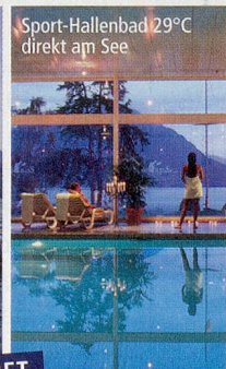
Sport-Hallenbad 29°C direkt am See