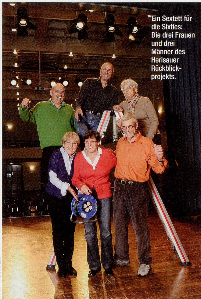
Ein Sextett für die Sixties: Die drei Frauen und drei Männer des Herisauer Rückblick-projekts.

«SF bi de Lüt» ist da buch-stäblich bei den Leuten und dokumentiert die nicht einfache Aufgabe, die sich die sechs gestellt haben. In acht Folgen werden die Organisations- und Probenarbeiten dokumentiert – und die Show vom 26. März.